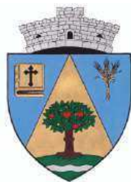
Stema comunei Almaș, județul Arad

Bibliografie: Stema comunei Almaș, județul Arad a fost aprobată prin Hotărârea de Guvern nr. 750 din 18 august 2023 și publicată în „Monitorul Oficial al României”, Partea I, nr. 762 din 23 august 2023; Marcel Sturdza-Săucești, Heraldica, Tratat tehnic București, Edit. Științifică, 1974, p. 53, fig. 49.