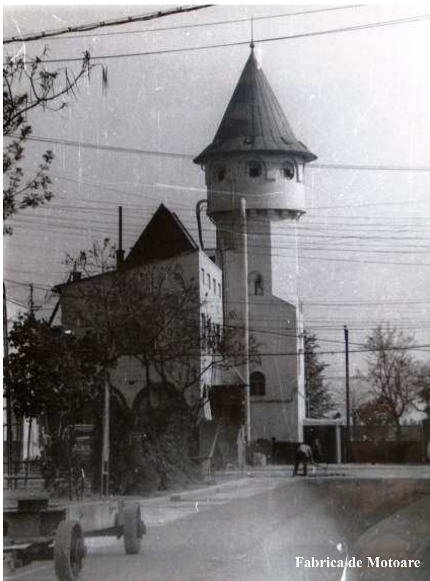
Fabrica de Motoare

O sumară evaluare critică a situației actuale, nu poate să ocolească intervențiile neinspirate asupra ansamblului de clădiri, lipsa de interes al proprietarilor care s-au succedat, în restaurarea corectă și conservarea grupului de imobile.