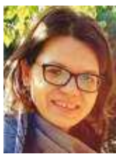
Carina A. Ienășel autumnală

privește-mă printre culorile difuze ale acestui timp încătușat în gândurile-atâta de confuze că nu mai știm ce e, ce nu... păcat.