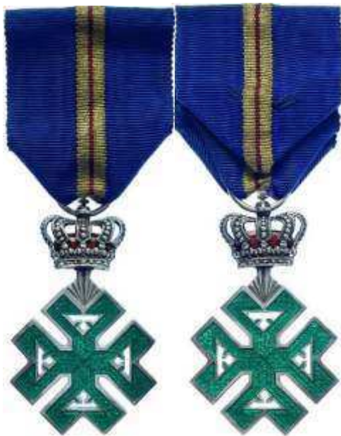
Ordinul „Ferdinand I” în gradul de Cavaler (avers și revers).

Ordinul „Ferdinand I” în gradul de Cavaler se prezintă astfel: o cruce smălțuită verde, cu marginile argintii, cu brațele egale, cu capetele despicate în forma a două litere „F” adosate și având deasupra coroana regală, argintie, cu toca smălțuită roșu. Panglica este de culoare albastru-închis, având la mijloc o dungă galbenă, străbătută de un fir de culoare roșie.